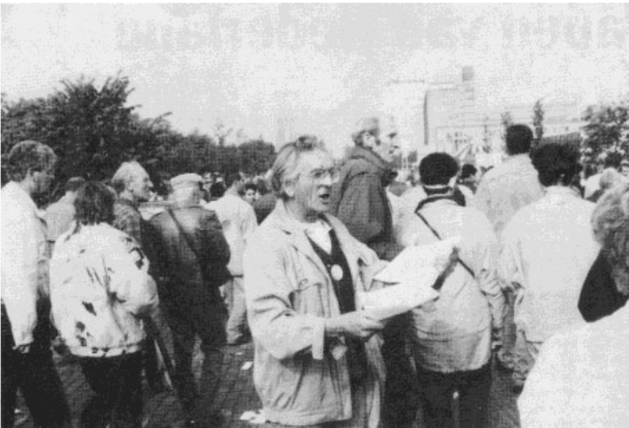
Toch nog een stemmingmaker in de buurt van het Malieveld

“Mijn uitgangspunt is dat je bij akties niet alles op de haalbaarheid moet gooien. Dat je alleen aktie voert, als je weet dat je resultaat verzekerd is. Ik heb namelijk in de loop der jaren te veel diskussies binnen de vakbeweging meegemaakt waarmee dat haalbaarheidsargument gebruikt werd om niets of weinig te doen. Natuurlijk moet je willen winnen. Maar aangaan van de strijd en helder maken waar je staat, is punt één. Dat inspireert mensen. Als het dan niet lukt, slaat het niet terug op jezelf en is je positie niet verzwakt.”