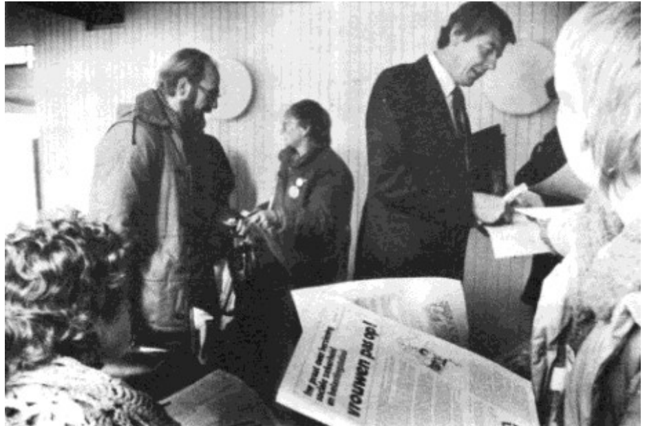
kongres Sociale Zekerheid, 25 oktober 1983

pen van kostwinnersbepalingen, het toekennen van eigen rechten aan de gehuwde vrouw, en in het algemeen: 'individualisering' van rechten en plichten. (Wie precies wil weten waar het bij die stelselherziening om gaat, verwijs ik naar de kritiek die naar aanleiding van de adviesaanvraag van de regering aan ser en emancipatieraad geschreven wordt vanuit het Breed Platform van Vrouwen voor Economische Zelfstandigheid en eind november uitkomt.)