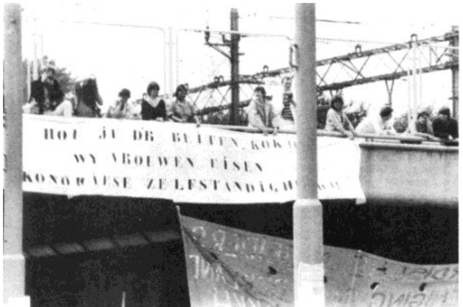
11 juni 1983 Utrecht