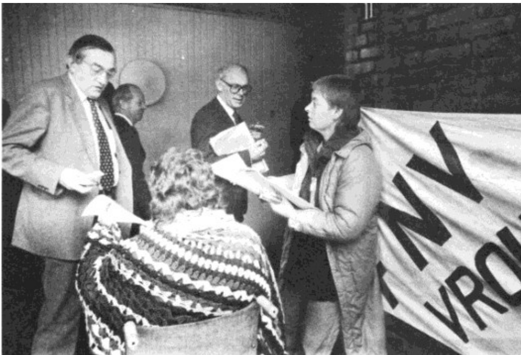
kongres Sociale Zekerheid, 25 oktober 1983

1. Het hiervoor genoemde Sekretariaat Vrouwelijke Werknemers . Door het sekretariaat is informatie verspreid aan vakbondsvrouwen (bijvoorbeeld in de Aktie-Nu'wsbrief) en het is ook zelf rechtstreeks betrokken geweest bij het opstellen van de nota's, al was dat in